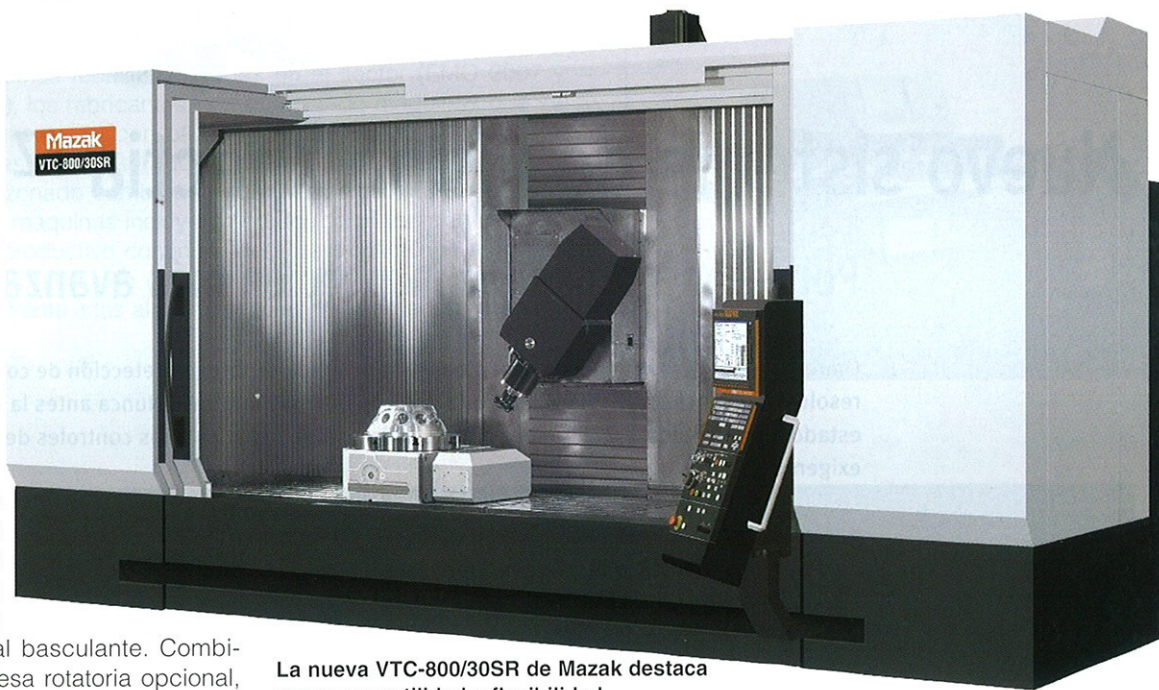
La nueva VTC-800/30SR de Mazak destaca por su versatilidad y flexibilidad

Además, sus ratios de avance de 50 m/min y una velocidad de husillo de 18.000 rpm añaden nuevas cotas al funcionamiento de esta máquina-herra-