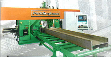
LÍNEAS DE TALADRADO CNC