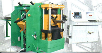
LÍNEAS DE ANGULARES