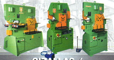
CIZALLAS / PUNZONADORAS

PEDDINGHAUS ESPAÑOLA S.A. • TEL: (34) 945 46 53 70 • EMAIL: PESA@PEDDINGHAUS.ES