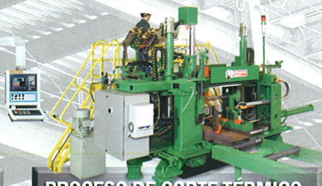
PROCESO DE CORTE TÉRMICO. PLASMA Y OXICORTE